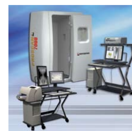
Цифровой флюорограф ПроСкан-7000.