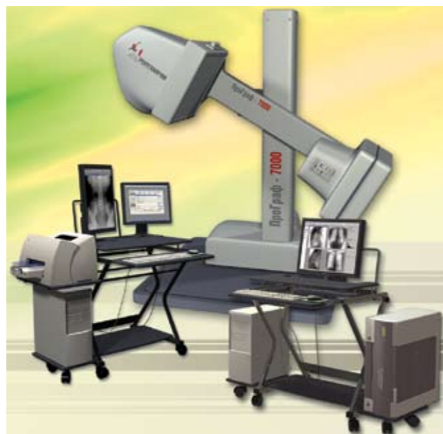
Цифровой рентгенографический аппарат ПроГраф-7000