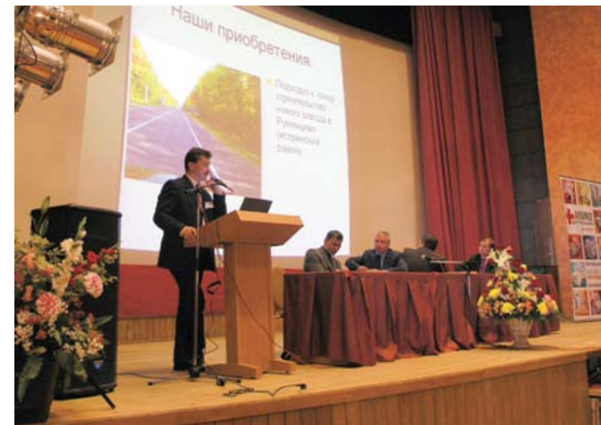
На семинаре компании, сентябрь.

Помимо производства рентгеновской техники мы ведем и широкую научно-методическую деятельность, направленную на сближение производителя и специалистов лучевой диагностики: мы постоянно проводим собственные семинары, участвуем в научных конференциях, на основе нашего оборудования ведутся научные работы. Так, в сентябре этого года