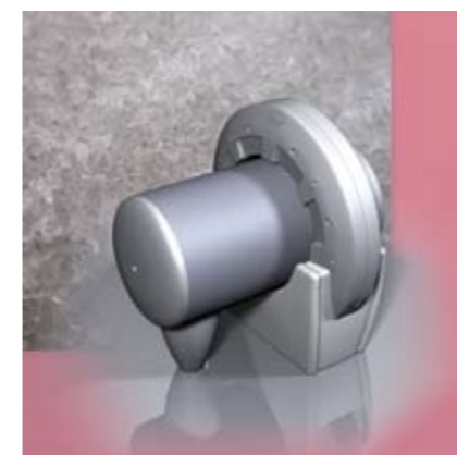
Комплекс для цифровой рентгенографии «Оптика-АМИКО»