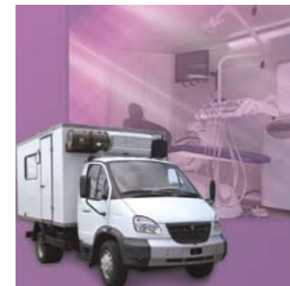
Кабинет стоматологический подвижной.