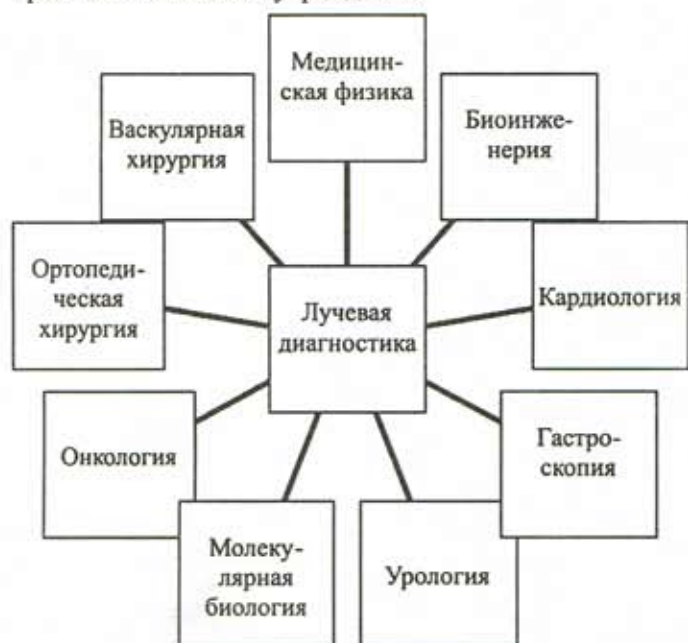
Рис. 2. Схема взаимодействия отделений лучевой диагностики с другими подразделениями лечебного учреждения

В настоящее время лучевая диагностика владеет мощным арсеналом средств, включающим в себя аппараты для РКТ, МРТ, УЗИ, ПЭТ, однофотонные КТ и др. С их помощью устанавливается и подтверждается более 70 % диагнозов. На рис. 2 представлена схема взаимодействия отделений лучевой диагностики с другими подразделениями лечебного учреждения, показывающая, что лучевая диагностика становится одним из центральных направлений лечебного учреждения.