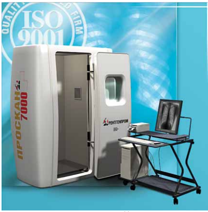
Сканирующий малодозовый флюорограф ПроСкан-7000®

варианты исполнения, передвижные флюорографические кабинеты.