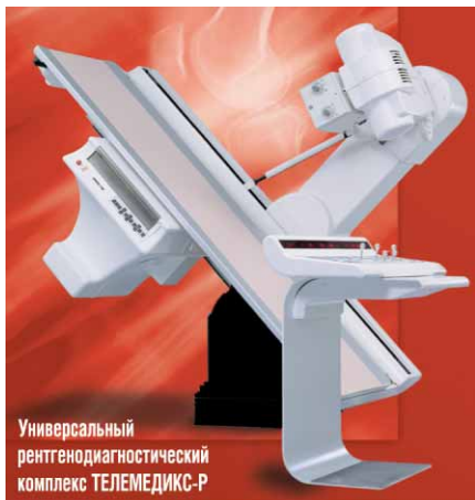
Универсальный рентгенодиагностический комплекс ТЕЛЕМЕДИКС-Р