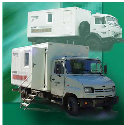
Передвижные флюорографические кабинеты

Особую гордость предприятия составляют передвижные флюорографические кабинеты. Более 150 машин работает в разных уголках России. РЕНТГЕНПРОМ был первой организацией, разработавшей и сертифицировавшей пленочные флюорографические кабинеты на базе ЗИЛ-