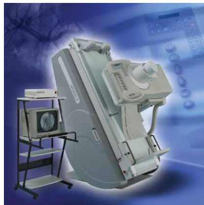
Рентгенодиагностический комплекс (РДК) МЕДИКС-Р

- Читателям «Медицинского бизнеса» хорошо знакомы рентгенодиагностические комп-