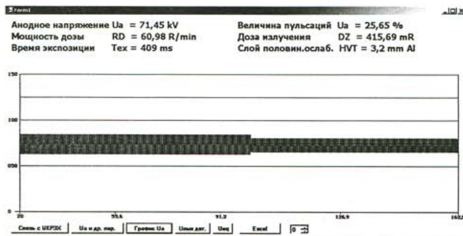
Рис. 2. Рабочее окно программы на экране ПК